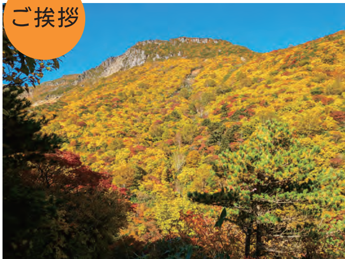
■鉄山・・・安達太良山(福島県)登山道の途中にある山。

残暑の候、貴社ますますご清栄のこととお慶び申し上げます。平素は格別のご高配を賜り、心から感謝いたしております。